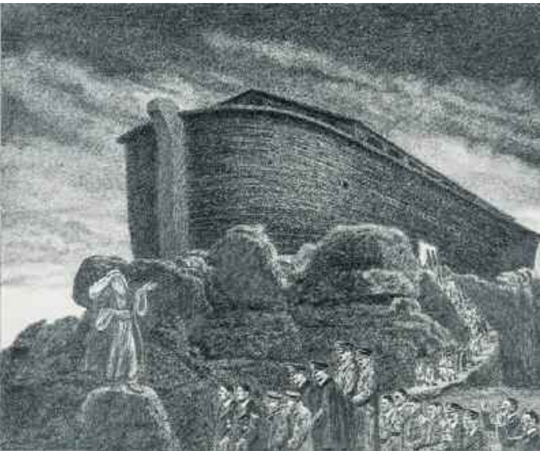
Noah's Ark / Κιβωτός του Νώε #1, 2013. Pencil on paper / Μολύβι σε χαρτί. 39 x 48 cm.