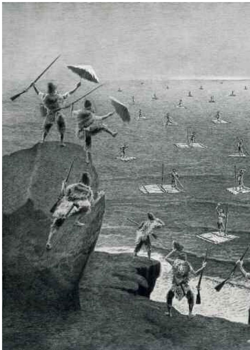
Robinsons Crusoes / Ροβινσώνες Κρούσοι , 2013. Pencil on paper / Μολύβι σε χαρτί. 100 x 140 cm.